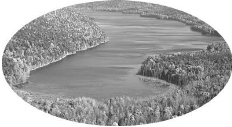
जलस्रोत जहां प्राणी अक्सर पानी पीने आते हैं।

वनरक्षक ये दावा करते हैं कि 'प्रोजेक्ट टाइगर' सफल रहा है और बाघों की संख्या में नियमित वृद्धि हुई है। इसकी पुष्टि के लिए आकलन प्रक्रिया, जिसे प्रायः