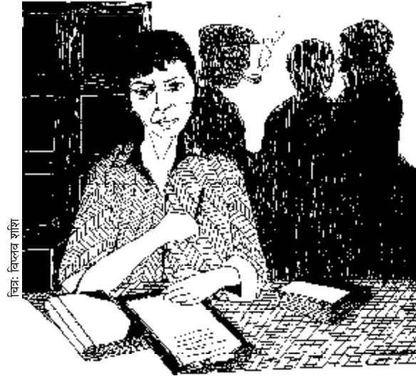
चित्र: विल्लव शशि

फिर मैंने बच्चों को लिया और पेरिस गई। वहाँ मुझे भौतिकी संस्थान में तुरन्त ही एक ऑफिस, और प्रयोगशाला में काम करने की जगह दी गई और वैसा ही व्यवहार मिला जैसा किसी भी वैज्ञानिक को मिलता। पर मेरे पति ने जो पहली घोषणा की वह यह थी कि दोपहर के भोजन या किसी भी और मामले में मैं उसके दोस्तों के समूह में शामिल न होऊँ। तब पहली बार उसने मुझसे कहा कि हम किसी भी हालत में कभी भी साथ काम नहीं करेंगे। उसका कहना था कि भौतिकी बहुत स्पर्धात्मक है, और वह हमारे बीच उभरने वाले किसी स्पर्धात्मक रिश्ते का दुष्प्रभाव अपने विवाह पर नहीं पड़ने देना चाहता। हमारे बीच किसी होड़ से बचने का उसका तरीका यही था कि मैं कभी कुछ बनूँ ही नहीं। “फिर हम घर लौट आए। लॉरेंस ने