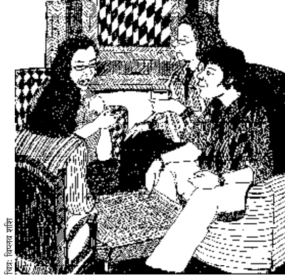
चित्र: बिल्कव शशि

“जब मैंने अपना डिज़रटेशन (थीसिस) लिखना शुरू ही किया था, बिल्कुल शुरुआती चरण में, तब लॉरेस ने अचानक तय किया कि वह दो साल के लिए पेरिस