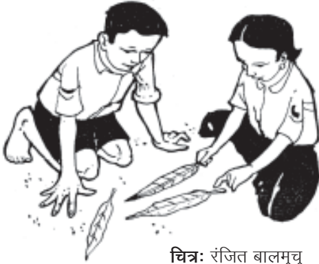
चित्र: रंजित बालमुचु

विविधता पाई जाती है। एक ही प्रजाति के कोई दो पेड़ एक जैसे नहीं होते, कोई दो पक्षी एक जैसे नहीं होते।