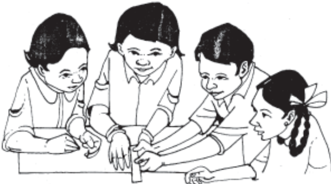
चित्र: रंजित बालमुचु

समीप गैलापेगोस द्वीपसमूह के अलग-अलग द्वीपों पर जन्तुओं के अध्ययन ने उनके विचारों को एक नई दिशा प्रदान की थी। यहाँ के विभिन्न द्वीपों पर फिंच नामक पक्षी पाए जाते हैं। डार्विन ने इन फिंच पक्षियों का काफी गहराई से अध्ययन किया था। फिंच पक्षियों के अवलोकनों के दौरान डार्विन ने उनकी चोंच पर भी ध्यान दिया था और उनके आकार को ध्यान से देखने के अलावा उनकी नपाई भी की थी।