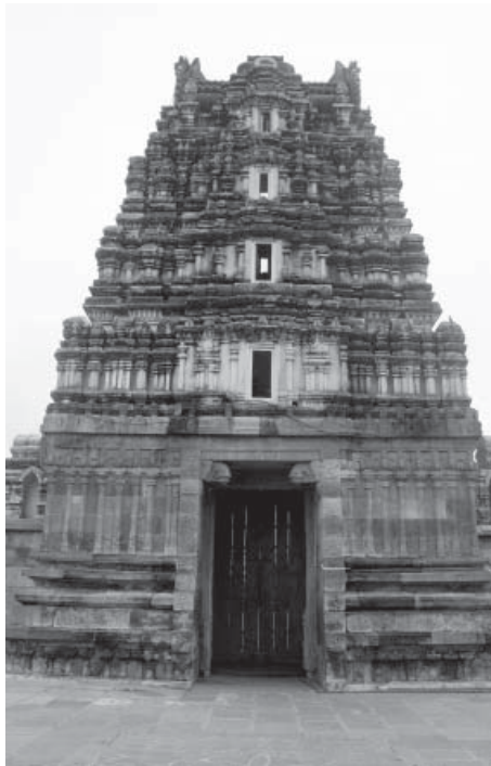
चित्र-1: कोडंडारामास्वामी मन्दिर

यह बात जनवरी 1986 की है जब मैं वॉटिमिट्टा के वन विश्राम गृह में रुका था। मैं उस सर्वेक्षण दल का सदस्य था जो 'जेरडॉन कोर्सर या डबल बैंडेड कोर्सर' नामक पक्षी की