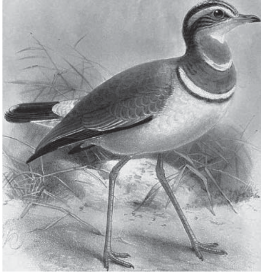
चित्र-2: जॉन जेराड क्यूलेमैन्स द्वारा बनाया गया डबल-बैंडेड कोर्सर का चित्र।

यह खोज मुझे पूर्वी घाट के कई अन्य इलाकों में ले गई। यह भागदौड़ और उससे सम्बन्धित समस्त यात्राएँ मैंने अपनी भरोसेमन्द मोटर-साइकिल (जिसे मैं एक